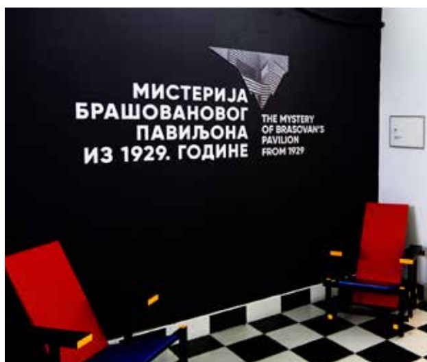
Misterija Brašovanovog paviljona iz 1929. godine, Muzej nauke i tehnike, Galerija 51

Kratak rezime: Elektrohemiја je jedna od naučnih disciplina po kojoj je Srbija globalno poznata. Međutim, o elektrohemiji, njenim oblastima, primeni koju ima u svakodnevnom životu, važnosti koju ona ima danas, a pogotovo koju će imati u budućnosti,