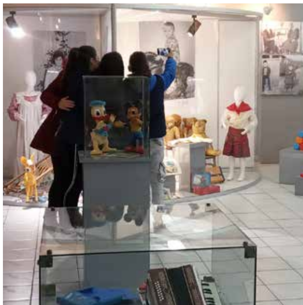
Borsko dete, Muzej rudarstva i metalurgije Bor

Kratki rezime: Cilj izložbe je bio da se publici predstavi i učini dostupnim jedan segment kulturnog nasleđa vezan za detinjstvo i odrastanje u periodu jugoslovenskog socijalizma, koji su u Boru obeležili rapidna urbanizacija, progres, modernizacija i integracija raznovrsnih identitetskih grupa. Istraživanja lokalne zajednice na osnovu kojih je realizovana izložba, bila su fokusirana na sećanja iz privatnog, svakodnevnog života. Na izložbi