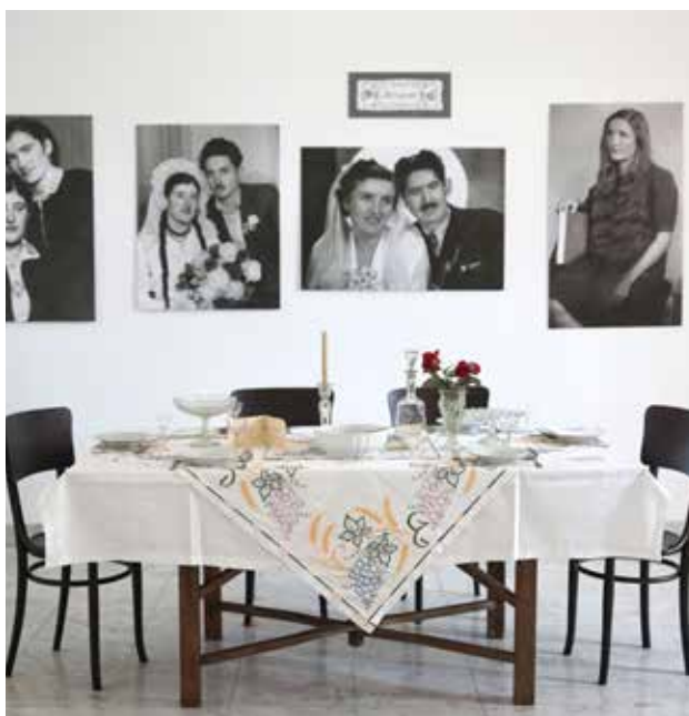
Mužiću zašto te nema? – obrazovanje u domaćičkim školama, Muzej slatka – Kuća Cvetića, Narodni muzej Kraljevo

Kratki rezime: Prva godišnjica rada Galerije Nikole Koke Jankovića obeležena je reprezentativnom izložbom skulptura Akademici u delima Nikole Jankovića . Nesvakidašnji koncept ove tako reći „izložbe na otvorenom” predstavlja umetnička dela u staklenom aneksu Galerije kako bi publika mogla da uživa u ekponatima i izvan galerijskog prostora. Izložene skulpture nastale su u periodu od 1949. do 2005. godine i predstavljaju svojevrsni presek opusa jednog od najznačajnijih portretista 20. veka, umetnika koji je ostao dosledan tradicionalnom figuralnom konceptu u skulpturi. Jankovićeve ekspresije kretala se od mimetičkog, preko analitičko-sintetičkog do modernog izraza koji su se međusobno preplitali najčešće bez jasnih granica. Izbor od jedanaest dela iz zbirke skulptura Galerije obuhvatio je neka od najznačajnija ostvarenja na kojima su predstavljeni likovi blistavih umova koji su obeležili nacionalnu i svetsku istoriju XX veka. Portreti biste, figure i plakete izvedene su u gipsu, terakoti i bronzi, u širo-