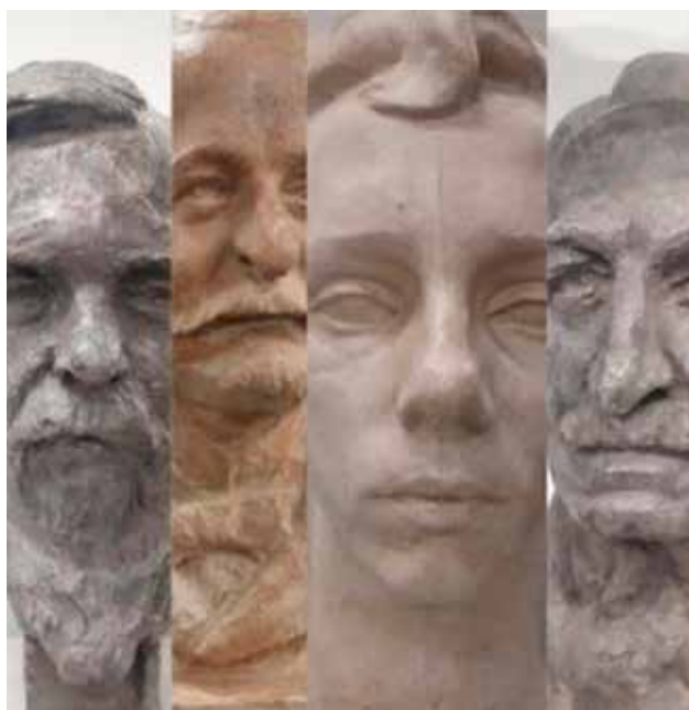
Akademici u delima Nikole Jankovića, Galerija Nikole Koke Jankovića