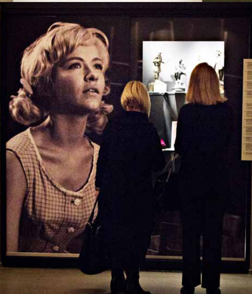
Naš muzej filma, Jugoslovenska kinoteka