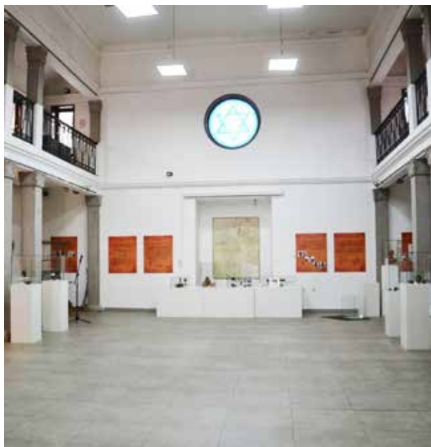
Vinčanska žena – mit, boginja, majka, Galerija Sinagoga , Narodni muzej Niš

Kratak rezime: Značaj projekta Vinčanska žena – mit, boginja, majka ogleda se u izrazitoj institucionalnoj saradnji, kao i pratećoj publikaciji Poznoneolitska i ranoeneolitska figuralna plastika iz severnih oblasti Centralnog Balkana . Reč je o studiji formiranoj na uzorku od 359 antropomorfnih i zoomorfnih figurina, koja predstavlja polazište za naučna tumačenja fenomena neolitske plastike. Izložba kroz postavku neolitskih figurina, kulturnih predmeta i drugog arheološkog materijala, uvodi posetioca u svet neolita, istražujući fenomen umetničkog izra-