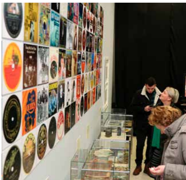
LP – Istorija gramofona i zlatno doba ploča, Gradski muzej Subotica