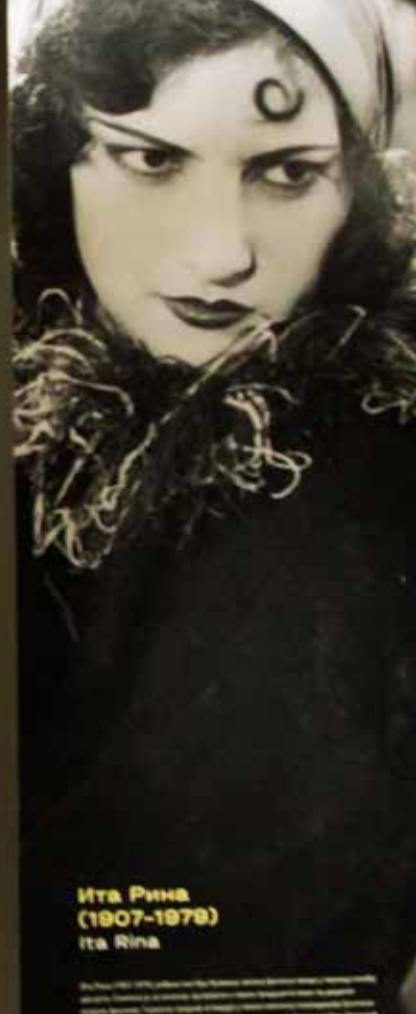
Ита Рина (1907-1979) Ita Rina

Ита Рина (1907-1979) је једна од највећих југословенских глумица. Њена каријера је почела у југословенском филму, а затим се прелила у француски и амерички филм. Она је глумила у више од 100 филмова, а њена улога у филму "Свадба у манастиру" је једна од најбољих. Ита Рина је умрла од срчаног удара 1979. године.