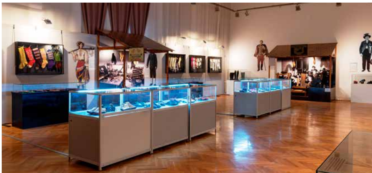
Ja nosim vas, vi nosite mene, Muzej Vojvodine