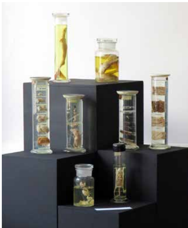
Priče iz depoa,

Rezime: Izložbom je predstavljena mađarska nacionalna zajednica, koja je poput drugih manjinskih zajednica u Vojvodini uspeła da sačuva svoj nacionalni identitet, negujući sopstveni jezik, folklor i narodnu tradiciju. Dok je na polju duhovne kulture taj identitet zadržao prepoznatljivost i izvornost, u materijalnoj kulturi, naročito u oblasti stanovanja evidentni su međusobni uticaji Mađara i slovenskih naroda, pre svih Srba, kao posledica kulturnih dodira. Gotovo identični geografsko-klimatski i drugi uslovi