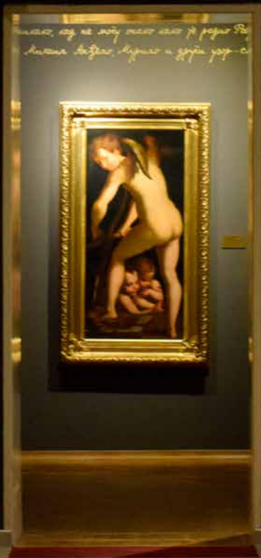
Inspirisani Italijom, Galerija Matice srpske