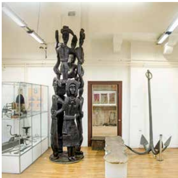
Skulptura samoukih vizionara – Klasici, Muzeja naivne i marginalne umetnosti, uključena je u stalnu postavku Zavičajnog muzeja, Jagodina

nedaće. Privremeno uživanje u kraljevskom životu okončano je krvavim krajem koji je ujedno označio i kraj epohe Obrenovića.