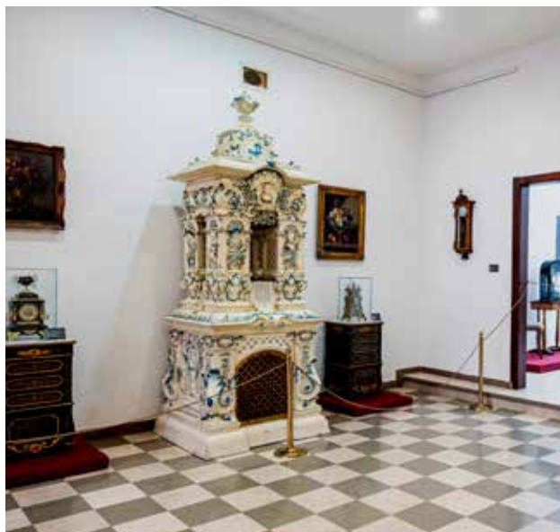
Vreme je za vreme , Muzej grada Novog Sada

Rezime: Reč je o nesvakidašnjoj ambijentalnoj postavci koja se sastoji od umetničkih instalacija izrađenih od prirodnih materijala, sa već prepoznatljivim autorskim pečatom Đorđa Lazića Čapše, u vidu upotrebe prirodnih pigmenata, apstraktnih pikturnih sistema znakova i geometrijskih formi. Vizuelno i tematski generisani.