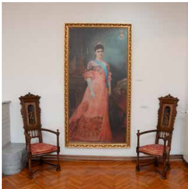
Kraljica Draga naša sugrađanka, Muzej rudničko-takovskog kraja

Kratki rezime: Predstavljajući umetnost koja nastaje u kulturno raznovrsnom i tehnološki naprednom svetu, ovogodišnji Memorijal treba da sagledamo kao izložbu umetnosti koja je savremena u svakom smislu, po sebi i za sebe. Drugim riječima, treba ga