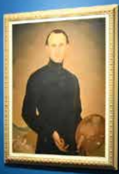
Portrait of a man in a dark suit, likely a historical figure, displayed on a blue wall.