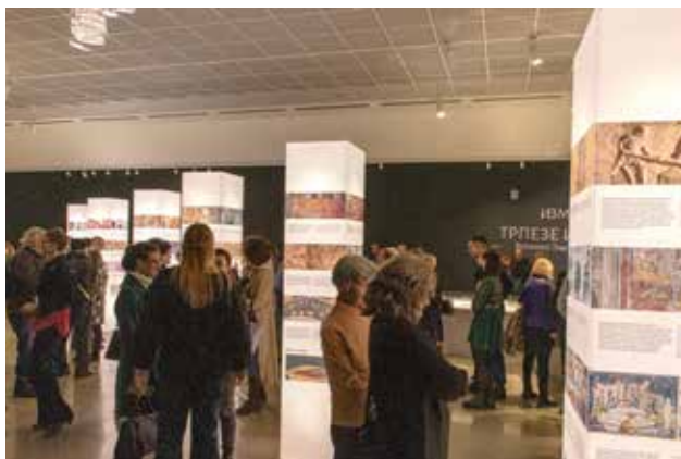
Između trpeze i sofre. Metalne posude od XIII do XIX veka u zbirnama Narodnog muzeja Srbije, Narodni muzej Srbije, Foto: Momir Vladislavljević

od najvažnijih umetnika 19. veka, izlažu se prvi put kao zasebna celina. Zaostavštinu crteža Novaka Radonića čini preko 130 crteža i pet skicen blokova, te je autorka izložbe iz tog bogatog opusa izdvojila ona dela koja najbolje svedoče o mestu crteža u Radonićevoj umetnosti i njegovom razvoju u vremenima brojnih aktuelnih umetničkih pravaca poput klasicizma, nazarenske umetnosti, bidermajera, romantizma i realizma. Većina ovih dela ga predstavlja kao pedantnog i preciznog crtača i majstora detalja. Posebno mesto u njegovom opusu zauzimaju crteži nastali tokom njegovog boravka u Italiji. Nakon povratka u domovinu, promene u doživljaju umetnosti, ali i realističke ideje koje je sve više usvajao, dovele su do postepenog odustajanja od slikarstva, u korist književnosti kojom se bavio ostatak života.