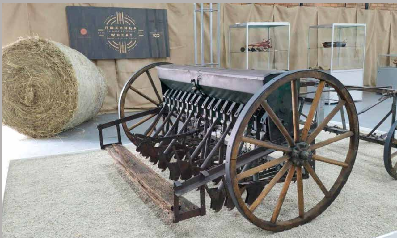
Pšenica – od njive do trpeze, Muzej Vojvodine