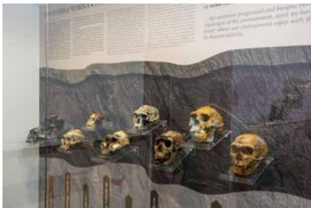
Evolucija čoveka, Narodni Muzej Leskovac