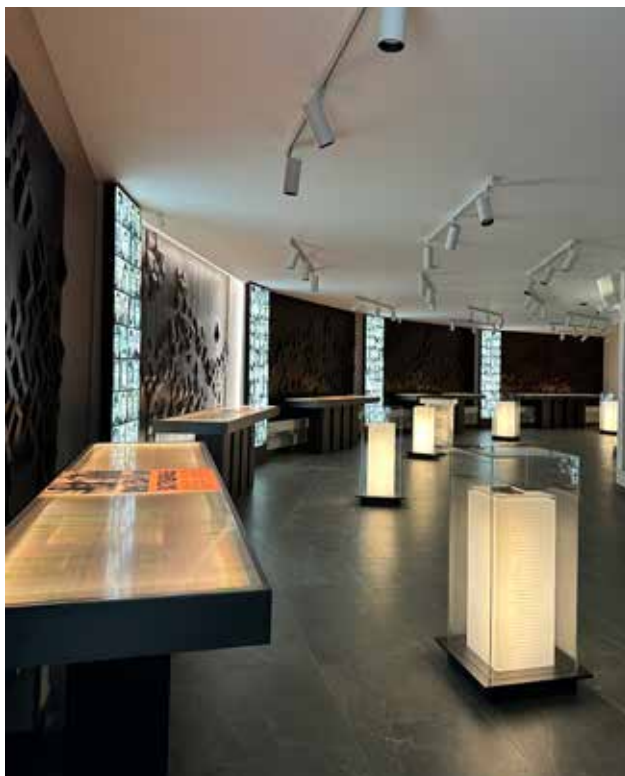
Kazneni zavod – logor u Kruševcu, Narodni muzej Kruševac

smisao njihove žrtve. Ovi elementi doprinose da prostor dobije ne samo na svojoj estetizaciji, već i na stvaranju memorijalnog mesta koje podstiče javnost, a pre svega lokalno stanovništvo, na stvaranje zajednice sećanja.