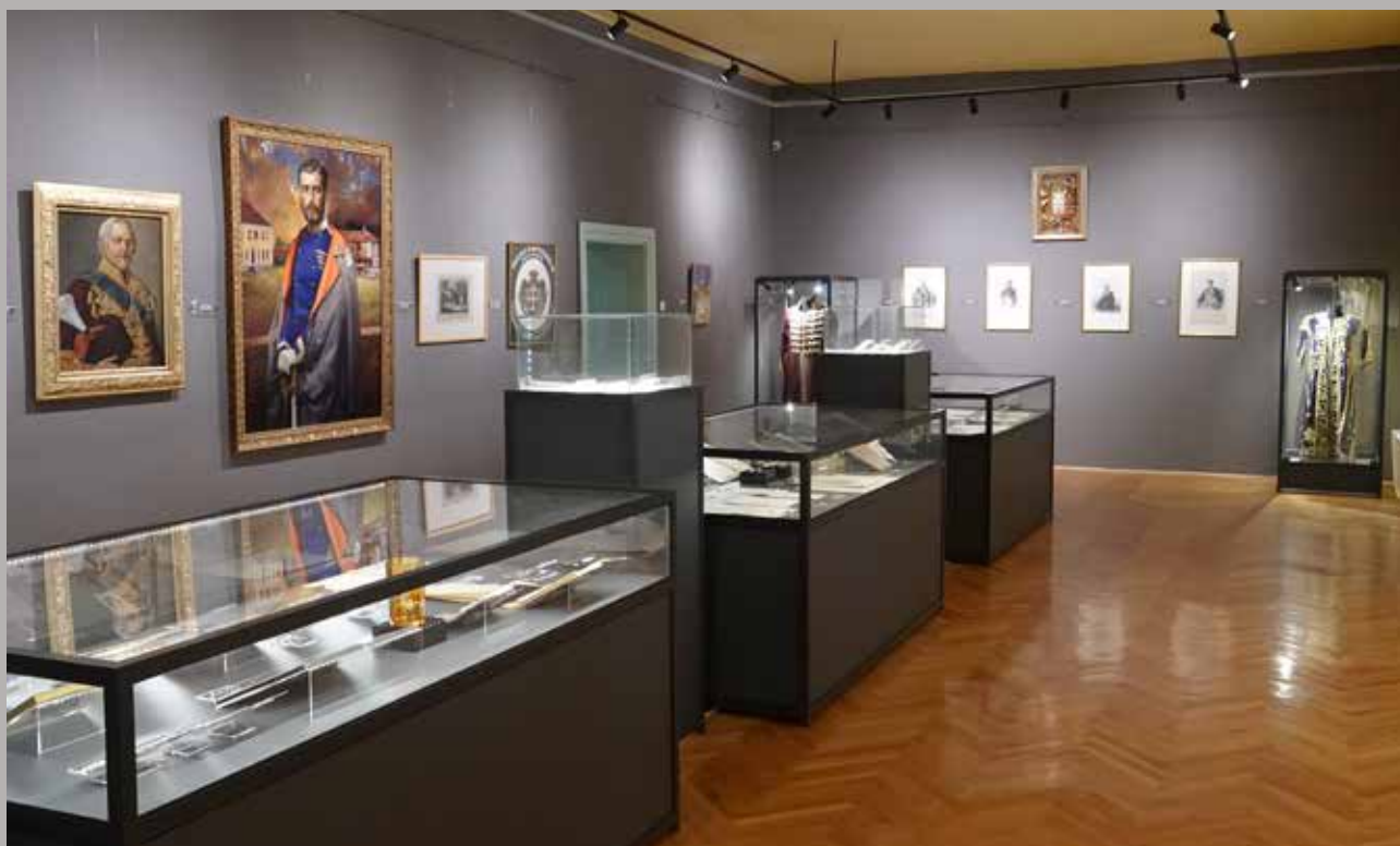
Knez Mihailo. Rođen u Kragujevcu, Narodni muzej Šumadije