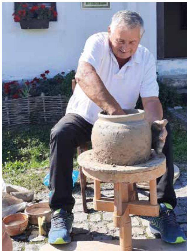
Nasleđe za budućnost i revitalizacija tradicijskih veština, Muzej na otvorenom Staro selo Sirogojno

Kratak rezime: Izložba je organizovana u cilju obeležavanja dana i slave udruženja tehničara radiologije