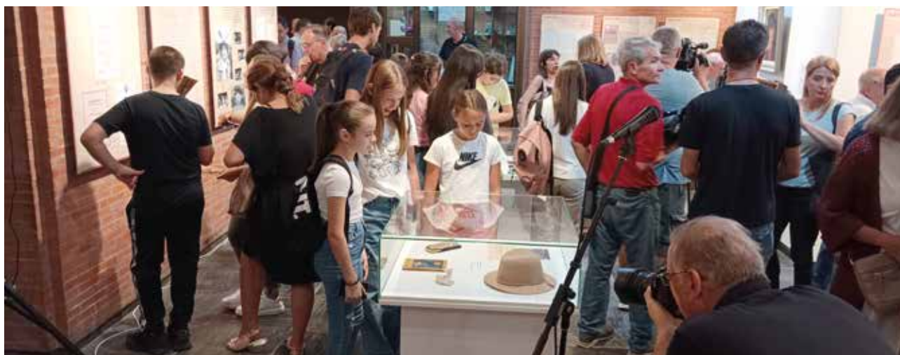
Bajka o pesmi, Spomen-park Kragujevački oktobar, Muzej 21. oktobar