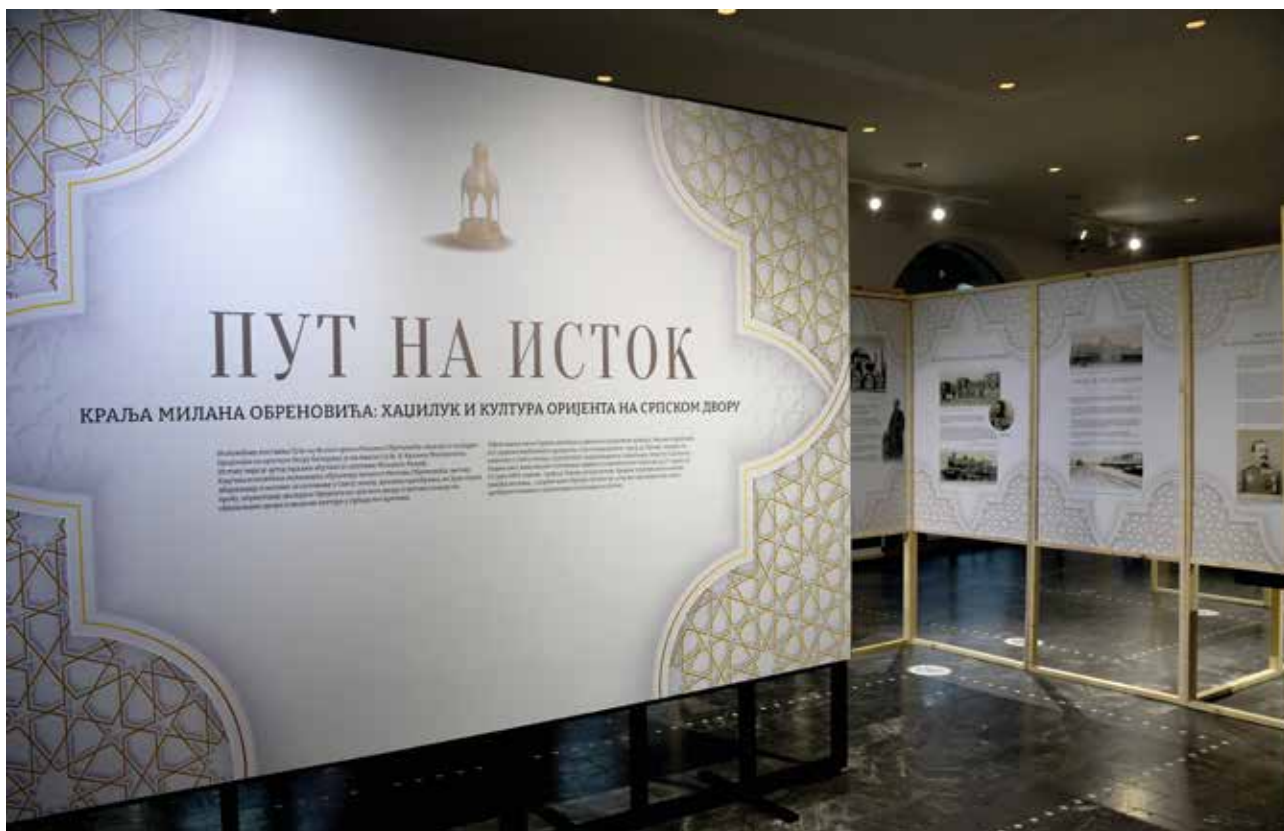
Put na istok kralja Milana Obrenovića: hadžiluk i kultura orijenta na srpskom dvoru, Muzej u Smederevu

Muzeja i obuhvata predmete koji su poklonjeni u dugom vremenskom periodu, od 60-ih godina 20. veka pa do dvehiljaditih. Treba istaći da je čak 90 odsto onoga što se nalazi u Istorijskoj, Numizmatičkoj i Etnološkoj zbirci muzeja dobijeno od darodavaca.