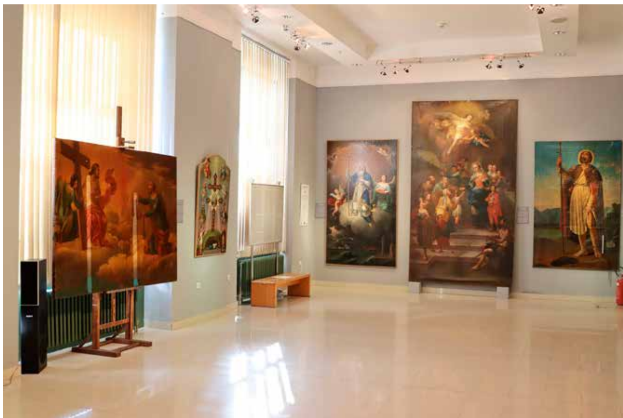
Slikarska Porodica Šeft iz Pešte, Gradski muzej Subotica

današnje Mađarske, Hrvatske, Rumunije i Srbije. Slikarska radionica Šeft (Schöffft, Schoeffft) u Pešti je delovala između 1770–1845. godine, a u njoj su stvarali Jozef Šeft Stariji, njegov sin Jozef Karl i unuk August, svetski poznati slikar. Njihovo stvaralaštvo obuhvata stilski period od kasnog baroka, preko klasicizma do romantizma i realizma. Na izložbi su prikazana njihova dela iz javnih, crkvenih i privatnih zbirki, od oltarskih slika do portreta vladara i kulturnih ilustracija periodike sa početka 19. veka. Subotica je bila posebno privrženica radionici Šeft, a Katedrala, koja je obeležila 250. rođendan, dekorisana je njihovim oltarskim slikama. Nakon Subotice, izložba je gostovala u Muzeju „Ištvan Tir” u Baji i Mađarskom nacionalnom muzeju u Budimpešti.