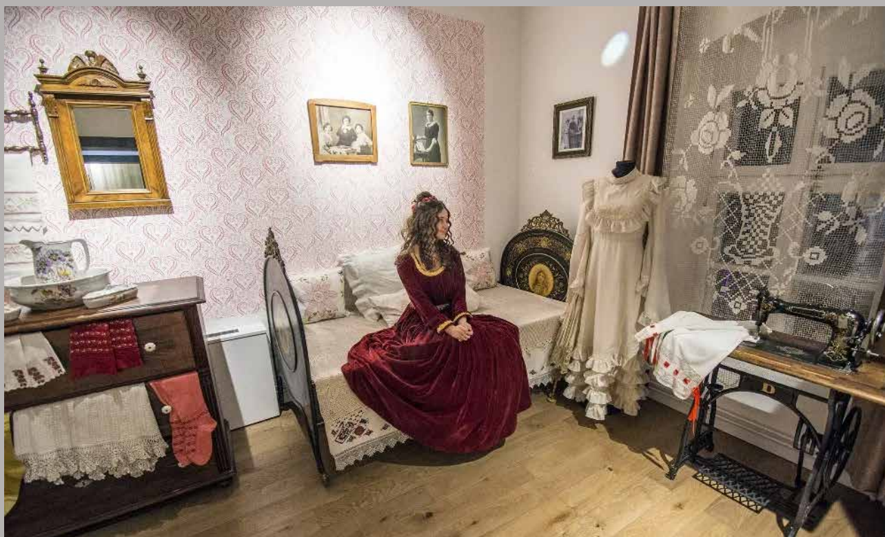
Stalna etnološka postavka u Hadžića kući, Narodni muzej Čačak