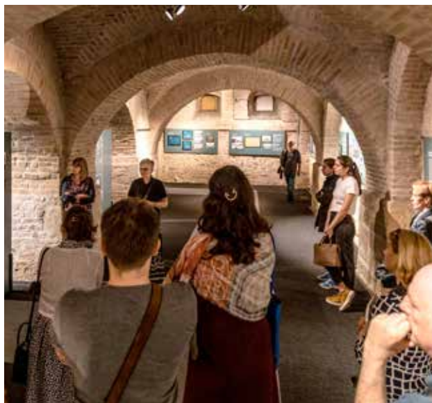
Iskorak ka modernosti – secesija u arhitekturi Beograda, Muzej grada Beograda, Foto: Vidak Orlović