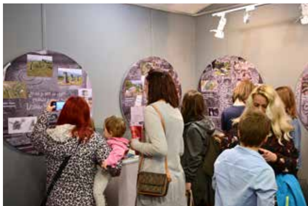
Večito, Zavičajni muzej Knjaževac