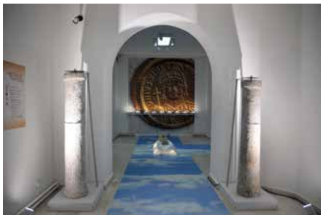
Na Jelici beše grad , Narodni muzej Čačak Foto: M. Bojović

predmetima antičke epohe, stvaraju metafiziku kako bi se zamaglile razlike između originala i kopije, tela i skulpture, života i umetnosti. Objedinjujući fotografske kadrove, poetski izraz, slike, crteže i neposredne arheološke fragmente, izložba povezuje vremenske dubine antičkog i savremenog prostora grada Čačka, imaginarnog i stvarnog, trajnog i prolaznog.