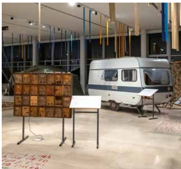
Ježeva kućica – izmišljanje boljeg sveta,

Kratak rezime: Centar za promociju nauke u saradnji sa Muzejom nauke i tehnike u Beogradu