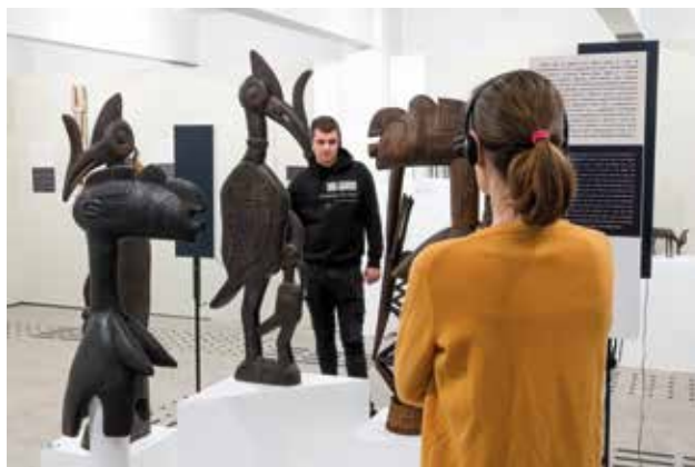
Vidi, dodirni, oseti – predmeti iz zbirki Muzeja afričke umetnosti, Muzej afričke umetnosti – Zbirka Vede i dr Zdravka Pečara

Mesto: Muzej afričke umetnosti – Zbirka Vede i dr Zdravka Pečara