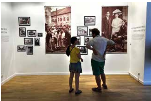
Paraćinsko staklo – kristalna nostalgija, Zavičajni muzej Paraćin

umetničkih dela, koja su nastala u periodu od 1932. do 1971. godine i obuhvataju portrete, aktove i pejzaže, nastale u tehnici akvarela, pastela i ulja.