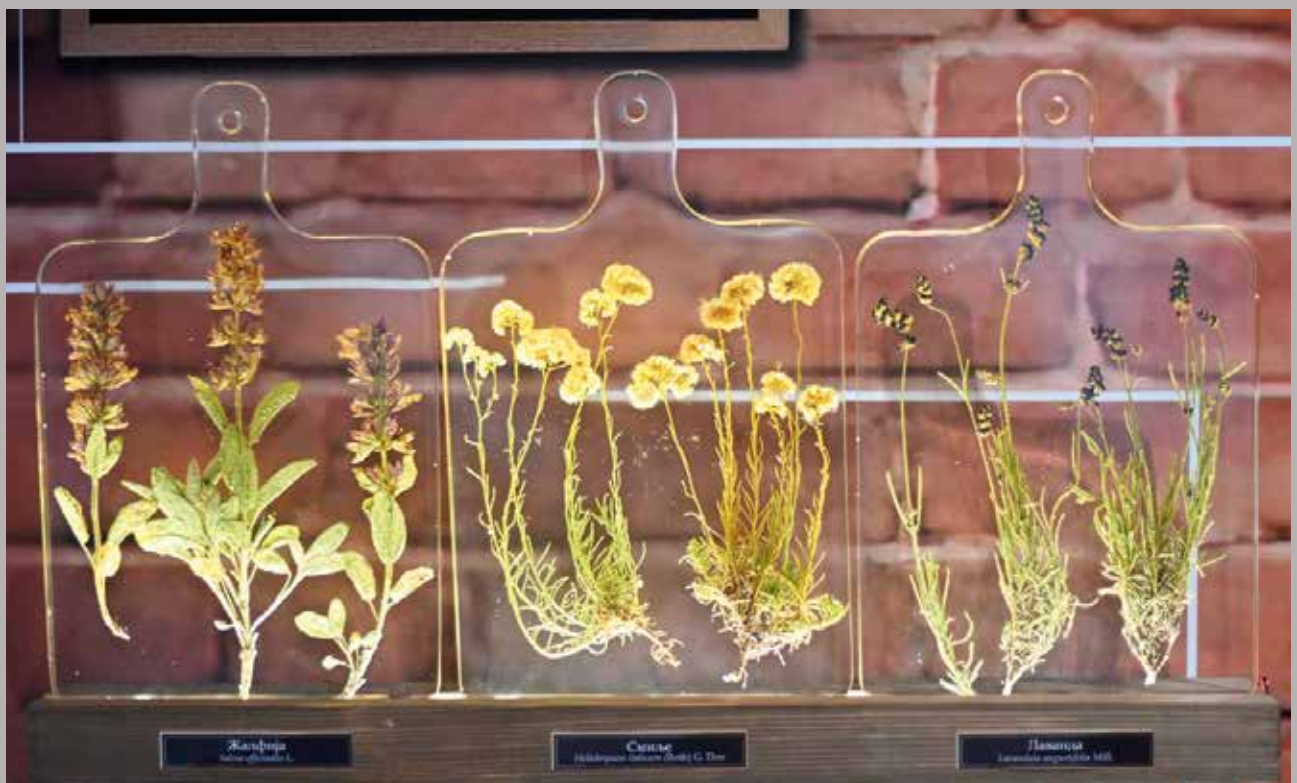
Uroš Buzurović, Biljka kao začin. U carstvu boja, mirisa i ukusa Prirodnački muzej, Beograd