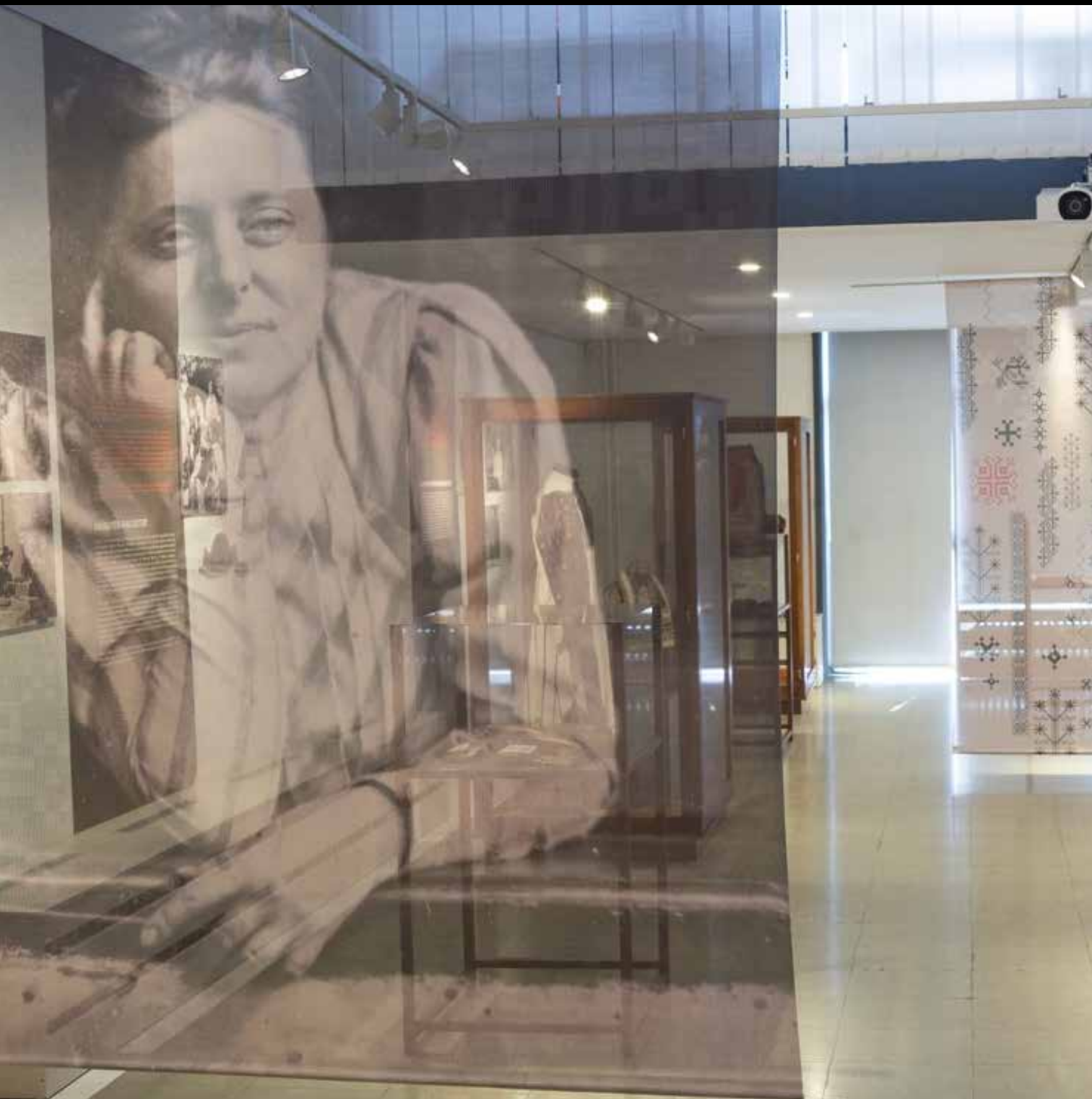
Nasleđe: kolekcija predmeta Nadežde Petrović, Etnografski muzej Beograd