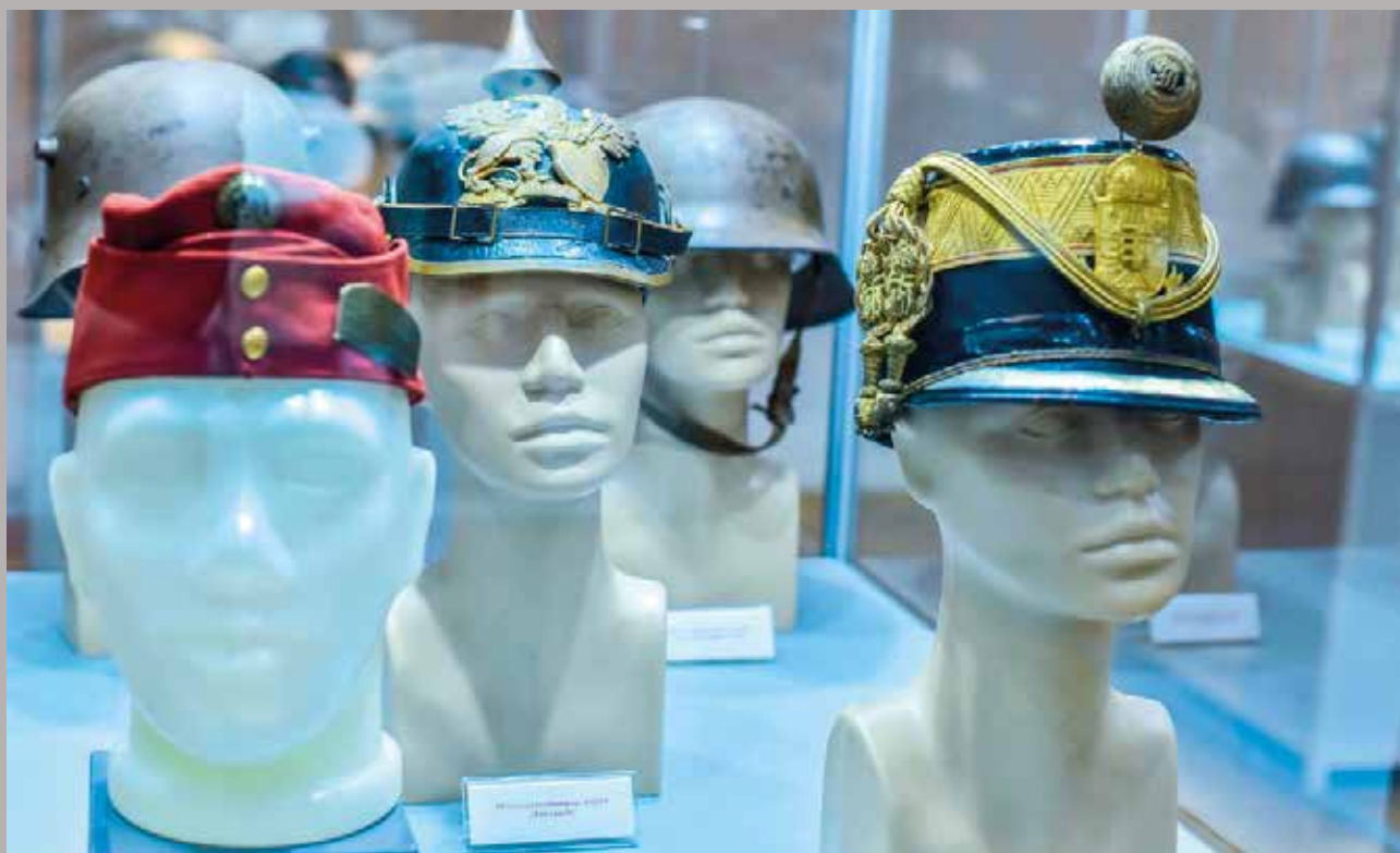
Vojne kape i šlemovi od sredine 19. veka do danas, Muzej Vojvodine