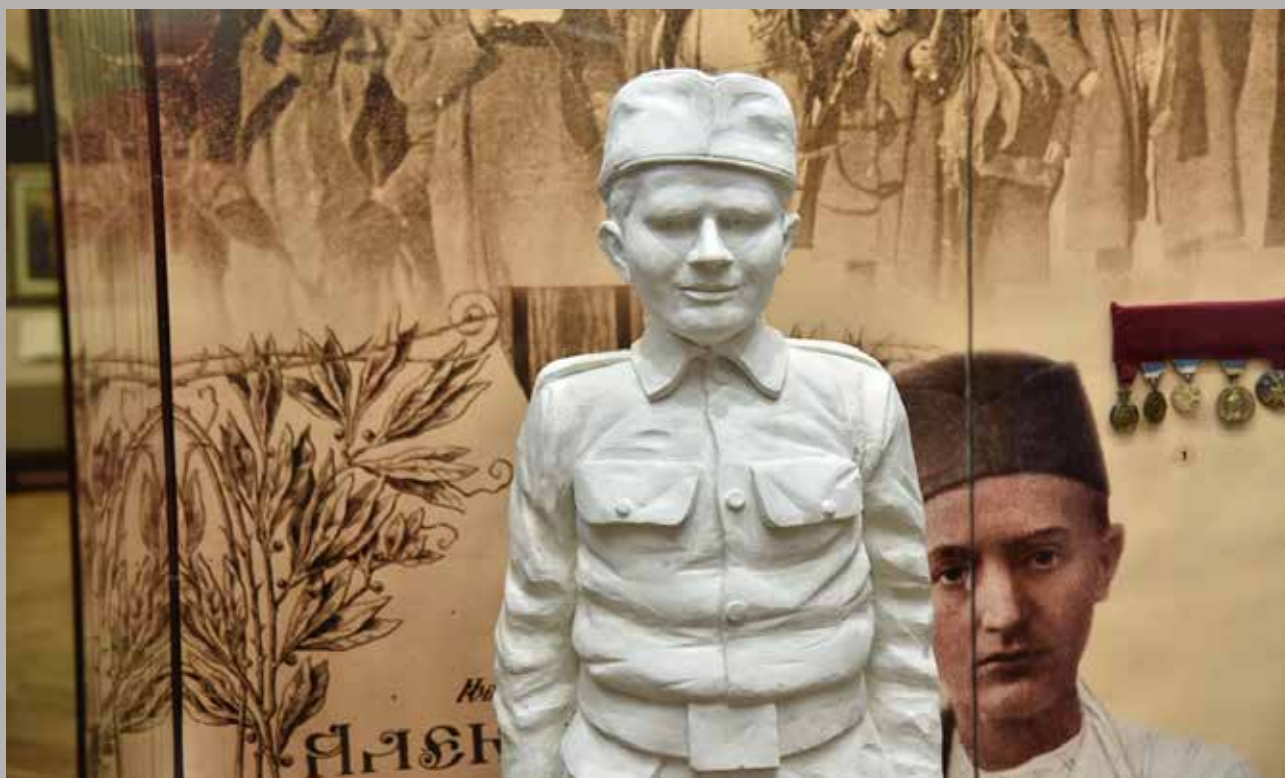
Modernizacija i rekonstrukcija stalne postavke Muzeja Jadra, Centar za kulturu Vuk Karadžić, Loznica