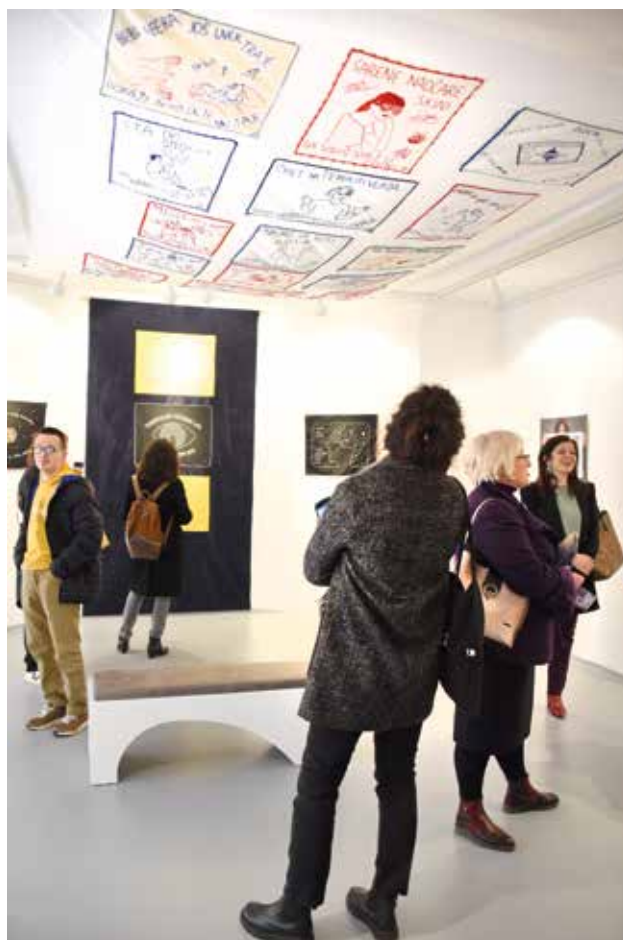
Nepraktične žene – kuvarice savremenog trenutka, Muzej naivne i marginalne umetnosti

Kratak rezime: Kamerna izložba slika i skulptura u okviru Stalne postavke MNMU, organizovana je