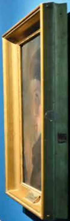
Portrait of a woman, likely a historical figure, displayed on a blue wall.