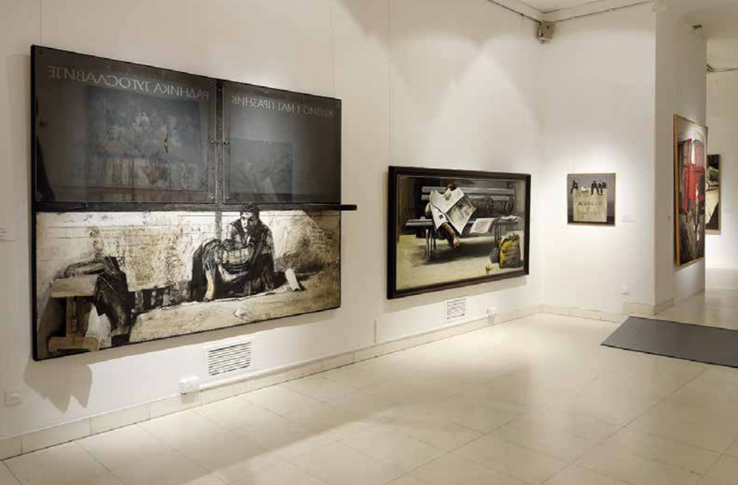
Mića Popović – slikarstvo permanentne pobune, Galerija SANU, Beograd

formata nastale u Parizu, tokom pedesetih i šezdesetih godina 20. veka. Drugi segment posvećen je topografskim odrednicama – Beogradu, Parizu i Njujorku, kao važnim životnim i umetničkim epicentrima, kojima je slikar posvetio serije slika.