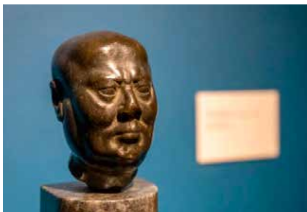
Poklon-zbirka Dragiše Brašovana, Galerija Matice srpske

Kratak rezime: Na izložbi su predstavljena tri ženska portreta iz tri muzeja: Galerije Matice srpske, Umetničko-istorijskog muzeja u Beču i Galerije