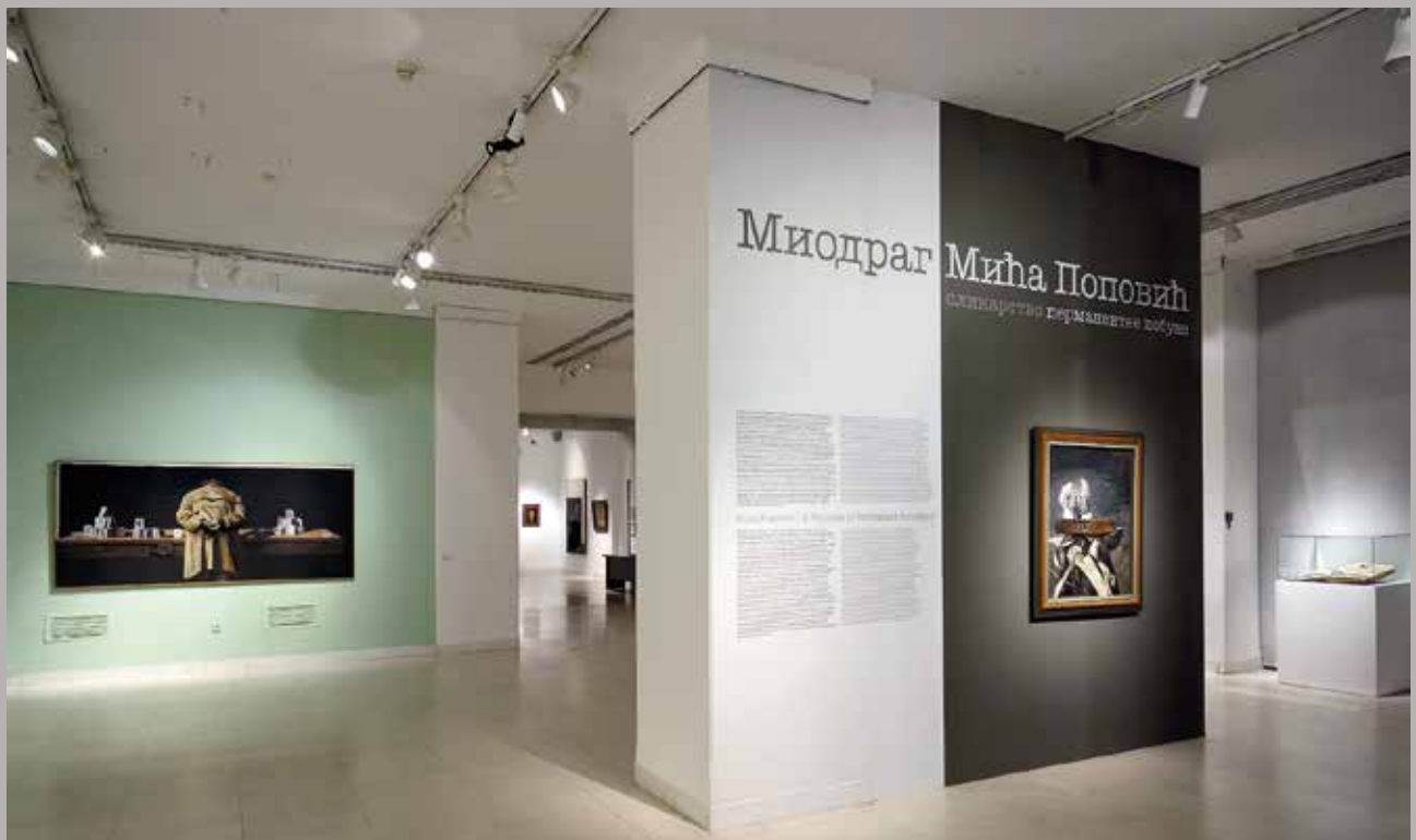
Mića Popović – slikarstvo permanentne pobune, Galerija SANU, Beograd