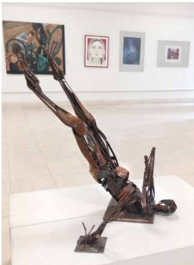
9. Bijenale Vranja 2023, Narodni muzej Vranje

Kratak rezime: Izložba predstavlja izbor slika, crteža i kolaža iz poklon-legata Vranjskog i obuhvata dela nastala u periodu od 1955. do 2015. godine. U Velikoj sali Galerije izložena su 74 dela.