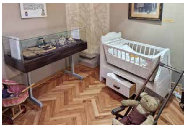
Akvizicije 1984-2023: izbor kustosa, Narodni muzej Pančevo