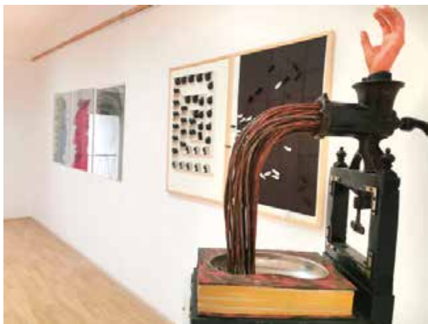
Otključavanje nadrealizma, Muzej Horreum Margi – Ravno Ćuprija

Čačku. Ovom izložbom je prvi put omogućeno da slepi i slabovidni posetioci uživaju u delima Nadežde Petrović. Za izložbu su, u vidu taktilnih ploča, prilagođene četiri slike Nadežde Petrović iz fonda Galerije, koje reprezentuju četiri perioda njenog stvaralaštva, od formativnog do ratnog – Bavarac sa šeširovom, Prizrenka, More i Gračanica . Taktilne ploče prate legende na Brajevom pismu i audio-zapisi sa biografijom umetnice, opširnijim narativom o prilagođenim slikama i uputstvima za doživljaj ploča dodirrom. Zahvaljujući đacima Umetničke škole u Čačku, u izložbu je uključena i replika biste Nadežde Petrović, rad Ivana Meštovića, prilagođena slepim i slabovidnim posetiocima.