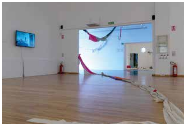
Stavovi i forme 02: mišljenje kao forma umetnosti, Muzej savremene umetnosti Vojvodine

Kratak rezime: Izložbu su kreirali Galerija DESSA (Ljubljana), časopis AB: Architect's Bulletin (Ljubljana) i platforma Architectuul . Početna kustoska koncepcija obuhvatila je izbor od trideset tri (33) spomenika i memorijalna kompleksa iz svih republika i autonomnih pokrajina bivše Jugoslavije, a