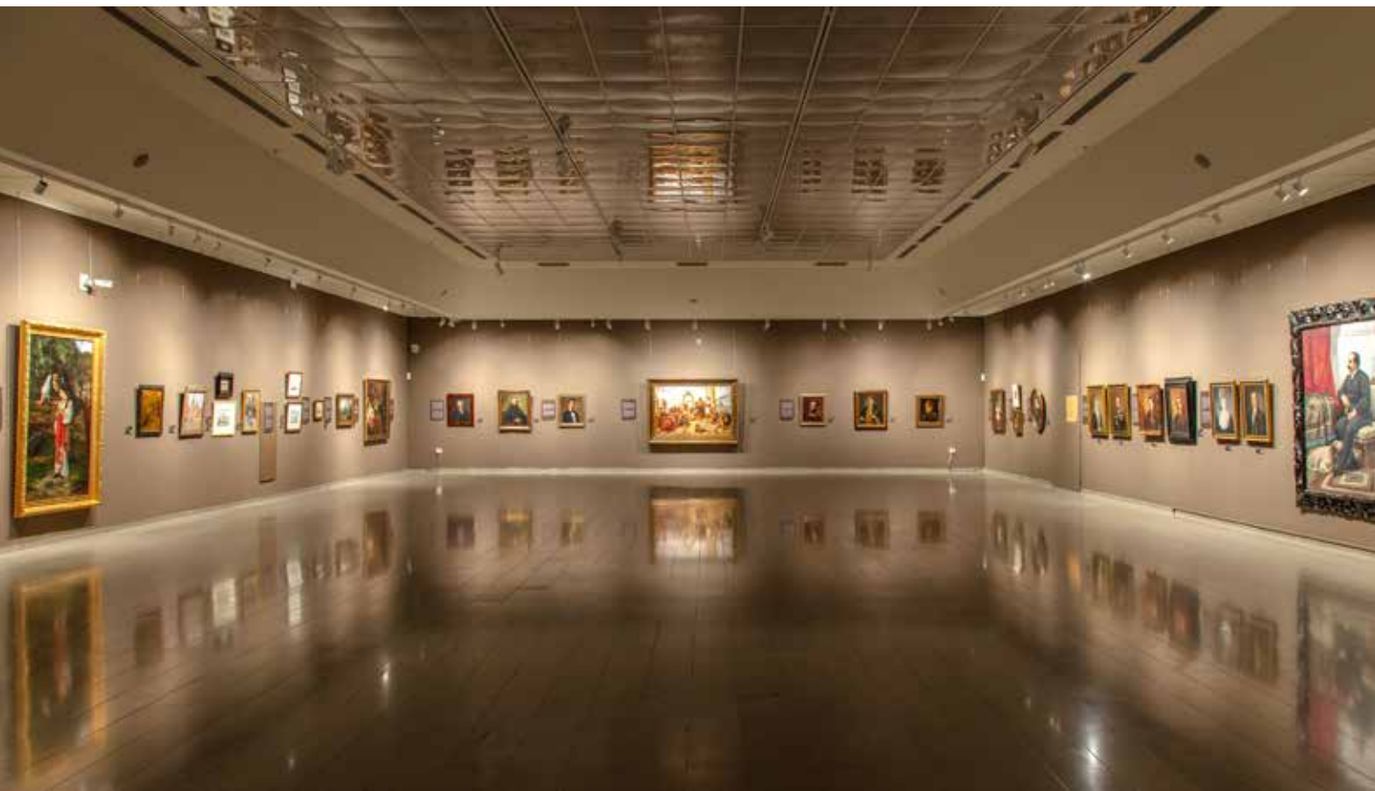
Jedna (ne)obična muzejska priča. Pedeset dela iz Zbirke srpskog slikarstva 18. i 19. veka Narodnog muzeja Srbije, Narodni muzej Srbije

strasti i temperamenta svojstvenih ovoj umetnici, spadaju u drugu celinu postavke. Posmatrajući crtački opus u odnosu na njena slikarska ostvarenja, nazire se intenzivan kontrast. Dok njene slike odišu bogatim koloritom i snažnom energijom, Nadeždine crteže odlikuju nežni tonovi i suptilnost u izvedbi, koje ne možemo ni naslutiti na njenim slikama.