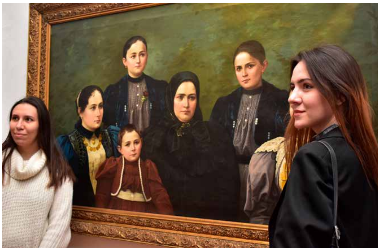
Budišini – priča o porodici kroz nekoliko portreta, Narodni muzej Kikinda

velikog formata i da se već poznati narativ o mamutici Kiki izmeni na deci prijemčiv način. Za razliku od već poznatog, tužnog, kraja u filmu o mamutu, novonastala slikovnica (izložba) ima srećnije rešenje. Izložba je nastajala šest dana tako što su učesnici programa, na osnovu skica, oslikavali velike pokretne zidove i tako stvarali slikovnicu.