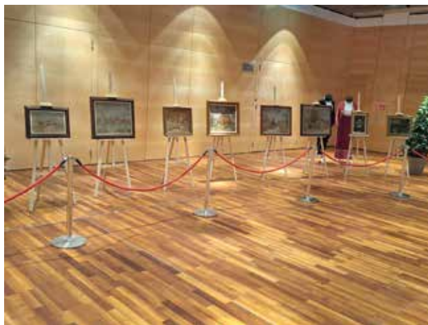
Evropska regionalna kultura, Muzej rudničko-takovskog kraja, Gornji Milanovac

Kratak rezime: Izložba predstavlja dela koja su autori, učesnici likovnog konkursa Matiću u čast , poklonili ili koje je Muzej otkupio od nagrađenih autora u proteklih 10 godina, koliko konkurs postoji. Na izložbi su predstavljena dela nagrađenih autora: Momčila