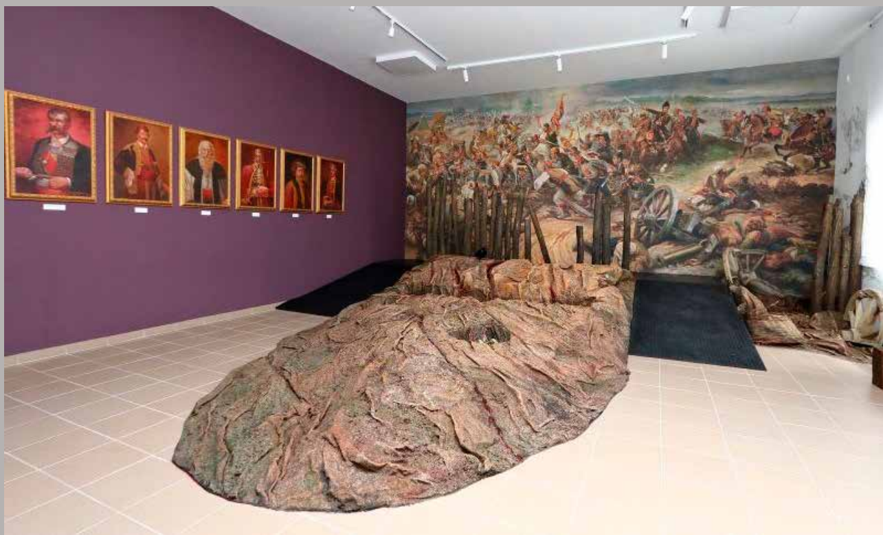
Boj na Mišaru, Depadans Narodnog muzeja u Šapcu – Muzej u Mišaru