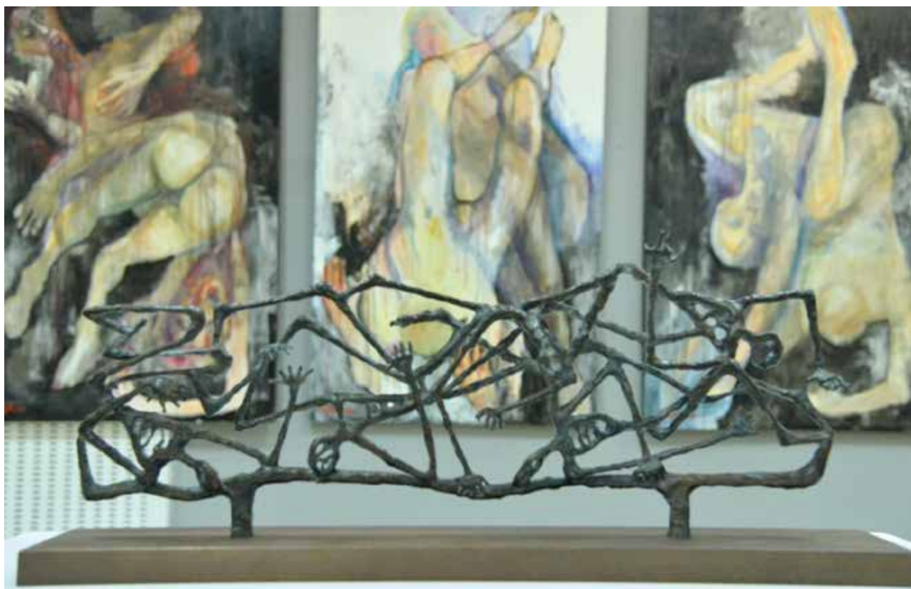
Mostovi svetlosti - izbor iz zbirke umetničkih dela Muzeja žrtava genocida, Muzej žrtava genocida