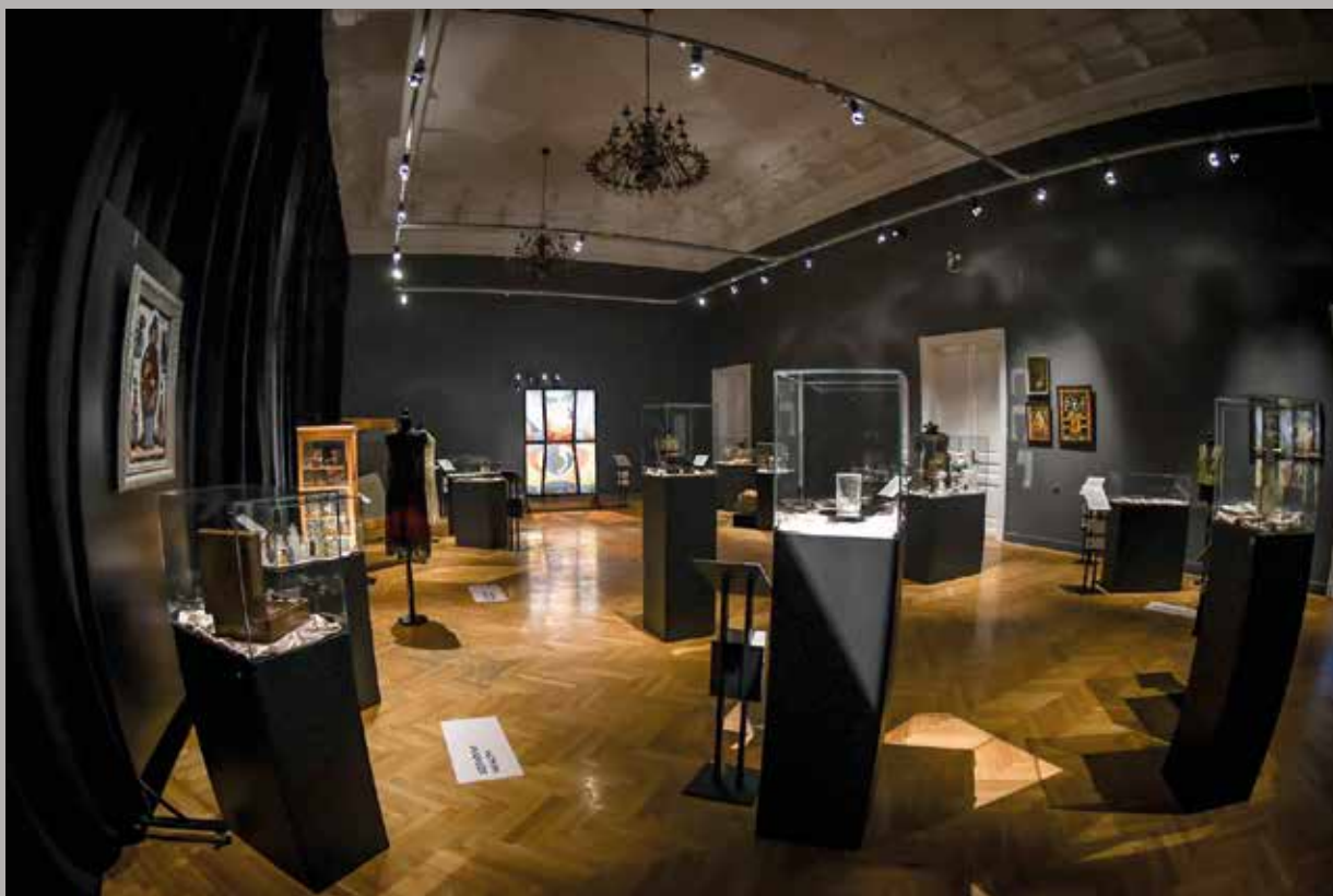
Staklo, Muzej Vojvodine