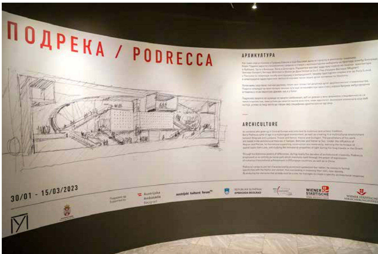
Podreka – Arhikultura, Muzej primenjene umetnosti, Beograd

i od onih koja to nisu. Četiri stotine originalnih autorskih dela, koliko ih je Podreka izradio do sada, predstavljena su kroz pregled njegovog načina rada. Njegov kreativan proces počiva na brojnim crtežima i arhitektonskim skicama koje izrađuje ručno na papiru, a značajno mesto pripada i maketama koje imaju funkciju vizualizacije poslednjeg, važećeg, izvodljivog ili već realizovanog rešenja.