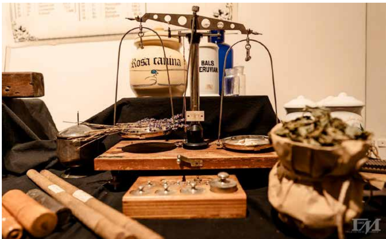
Od zločina magije do umetnosti farmacije – A magiae crimine ad Artem pharmaciae, Gradski muzej Sombor