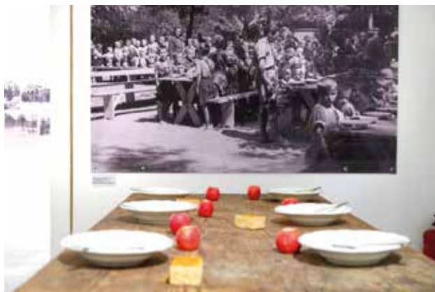
Deca u ratu: Srpski izbeglički domovi u Mataruškoj Banji 1942–1944, Narodni muzej Kraljevo

Kratak rezime: Mataruška Banja, kao lečilište i turističko mesto, počinje da se razvija u prvim godinama XX veka. Iako je jedna od najmlađih banja,