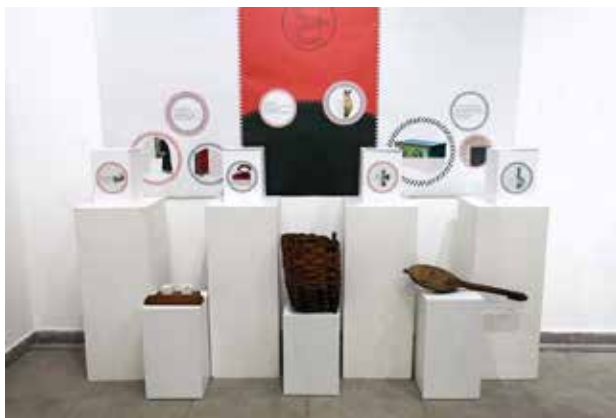
Etnologija u muzeju: šta oni tamo rade? Narodni muzej Niš

Kratak rezime: Na izložbi je zastupljeno 30 srpskih umetnika druge polovine 20. veka koji su, kao vodeći protagonisti likovne scene Srbije, dali značajan deo aktuelnih likovnih produkcija na ovim prostorima. Prikazana dela nastala su tokom sedamdesetih i osamdesetih godina 20. veka, kada je došlo do promena u statusu umetničkog dela, kao i niza novoformiranih inovativnih umetničkih pozicija. Tada su se izdvojile dve osnovne struje: jedna koja je negovala klasične akademske principe i druga koja je otvorenim kritičkim stavom ukazivala na aktuelna pitanja i nedoumice društvenog trenutka.