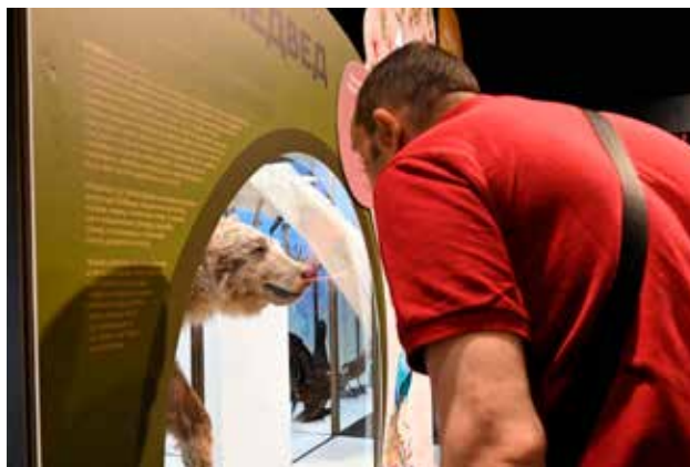
Priroda i jezik, Prirodnjački muzej, Beograd

od najvažnijih umetnika 19. veka, izlažu se prvi put kao zasebna celina. Zaostavštinu crteža Novaka Radonića čini preko 130 crteža i pet skicen blokova, te je autorka izložbe iz tog bogatog opusa izdvojila ona dela koja najbolje svedoče o mestu crteža u Radonićevoj umetnosti i njegovom razvoju u vremenima brojnih aktuelnih umetničkih pravaca poput klasicizma, nazarenske umetnosti, bidermajera, romantizma i realizma. Većina ovih dela ga predstavlja kao pedantnog i preciznog crtača i majstora detalja. Posebno mesto u njegovom opusu zauzimaju crteži nastali tokom njegovog boravka u Italiji. Nakon povratka u domovinu, promene u doživljaju umetnosti, ali i realističke ideje koje je sve više usvajao, dovele su do postepenog odustajanja od slikarstva, u korist književnosti kojom se bavio ostatak života.