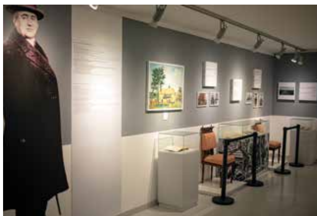
Milutin Milanković – 100 godina od reforme Julijanskog kalendara, Muzej nauke i tehnike, Beograd

Kratak rezime: Izložba je bazirana na arhivskim dokumentima, bibliografskim podacima, ličnim predmetima, opisima najznačajnijih događaja iz života i rada Milutina Milankovića, kao i eksponatima Muzeja nauke i tehnike, koji su svedoci tehničkih dostignuća korišćenih u tadašnjoj epohi. Uz biografske podatke Milutina Milankovića, priču o detinjstvu i školovanju, građevinskoj praksi, patentima, naučnom radu na Beogradskom univerzitetu, matematičkom proračunu mehanizma i astronomskog kalendara klimatskih promena u prošlosti, centralna tema izložbe je jubilej – stogodišnjica Milankovićeve reforme kalendara, događaja koji se pamti kao revolucionarna prekretnica u usaglašavanju dužine kalendarske godine sa dužinom prirodne astronomske godine.