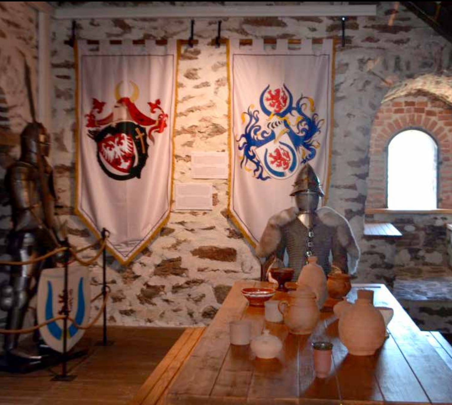
Život u utvrdenju u srednjovekovnom Banatu, Gradski muzej Vršac