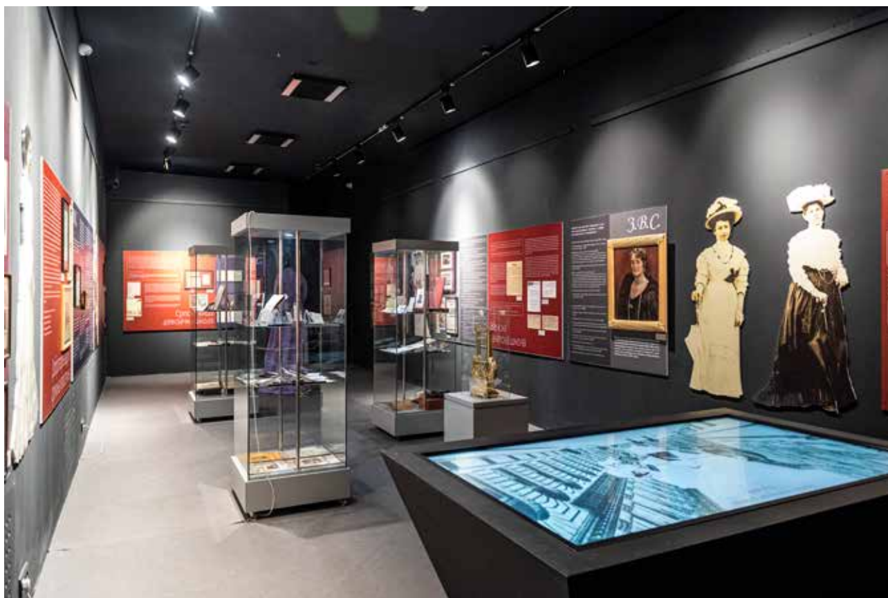
Ženska strana Grčkoškolske ulice, Muzej grada Novog Sada

Kratak rezime: Slikar užarene vojvođanske ravnice, Milan Konjović, bio je ekspresionista i plenerista, muzealac, zavičajni galerista i akademik, koji svojim ukupnim delom označava jednu od najmarkantnijih pojava srpske umetnosti 20. veka. U minijaturnom formatu izložbe u Ogranku SANU predstavljeno je devet slika koja ukazuju na njegov jedinstven umetnički izraz kroz raznovrsnu tematiku: pejzaže, jedan portret, mrtve prirode i aktove.