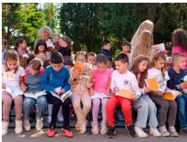
Trstenička slovarica, Narodni univerzitet Trstenik

Kratak rezime: Izložba, koju je pratio opsežan katalog sa svim biografskim i bibliografskim podacima o autorima i njihovim delima koja baštini Narodni muzej u Šapcu, predstavljala je krunu višegodišnjeg rada, koji je podrazumevao ne samo prikupljanje podataka, nego i konzervaciju i restauraciju izloženih dela. Zahvaljujući izložbi moglo se steći saznanje o razvoju likovne umetnosti ovog kraja (delimično i Srbije) od polovine 19. veka do danas.